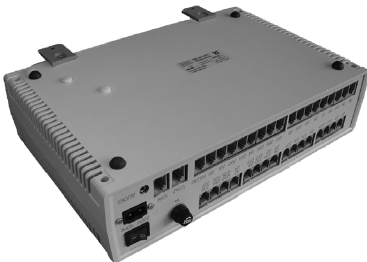
Рисунок А2.2 Внешний вид установочной плоскости МСС МР35